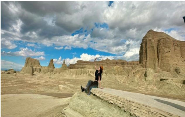
Thành phố quỷ trên Biển