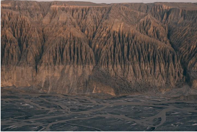
Hẻm núi lớn Dushanzi