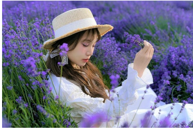
Trang viên hoa oải hương

Sáng: Ăn sáng tại khách sạn. Sau bữa sáng, đoàn làm thủ tục trả phòng. Xe và HDV đưa đoàn khởi hành đi Yining . Trên đường đoàn ghé thăm: