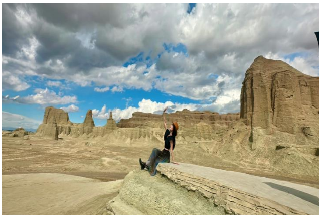
Thành phố quỷ trên Biển