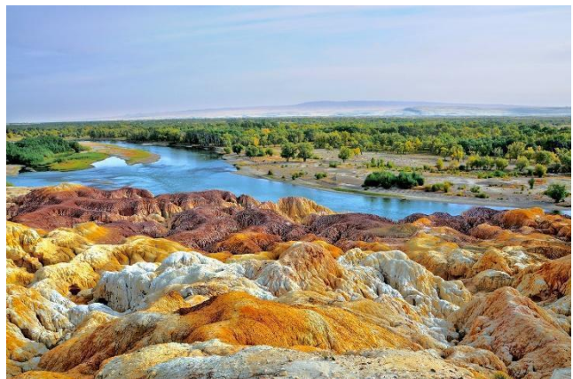
Bãi Ngũ Sắc

Sáng: Quý khách ăn sáng tại nhà hàng sau đó xe đưa quý khách đi chuyển tham quan, bằng qua tuyến đường cao tốc sa mạc S21. Trên đường đi, quý khách sẽ có cơ hội chiêm ngưỡng phong cảnh thiên nhiên tuyệt đẹp được tạo nên bởi sa mạc rộng lớn.